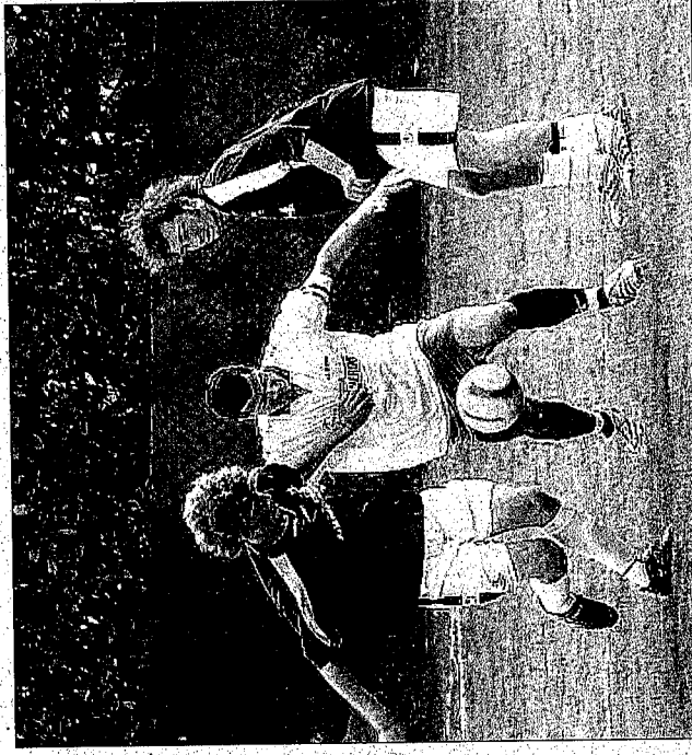
Grassina e Union Team Chimera non sono riuscite a trovare la via della rete, alla fine il risultato è rimasto inchiodato sullo 0-0